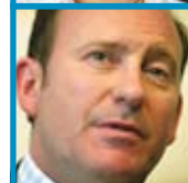
Rik Daems Volksvertegenwoordiger