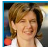
Patricia Ceysens Vlaams minister